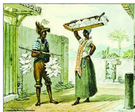
Obras do artista francês Debret podem ser apreciadas em museu, no Centro

ação da Escola Real de Ciências Artes e Ofícios, no Rio de Janeiro, inspirada nas academias de artes francesas, onde atuou como pintor da Corte de Napoleão. Permaneceu no Brasil entre 1816 e 1831, como pintor de assuntos oficiais do Império e professor de pintura histórica. Retornando à França, Debret organizou o material iconográfico que produziu durante os anos vividos no Brasil, publicando Viagem Pitoresca e Histórica ao Brasil em três volumes, dedicados aos índios, aos elementos da natureza, ao cotidiano do Rio de Janeiro, à Corte com suas festas, aos cerimoniais religiosos, ao negro e à paisagem brasileira. (Da Redação)